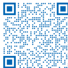
Таблица изменений реквизитов, идентифицирующих налог (ОКТМО и КБК)